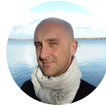
Pierre-Yves Billard www.vivresavue.fr

Elle co-fonde en 2011 AYOg à Nantes et y enseigne différentes formes de Yoga : hatha et kurma yoga, yoga du son (et bain sonore), yoga nidra, méditation. Elle transmet une pratique à la fois emprunte d'originalité (nourrie par son passé de danseuse-chorégraphe-performeuse) et de tradition (diplômée de l'EFYO, de l'EYM, de l'Institut du Yoga du son et des arts de la voix). L'éveil de la conscience, l'ouverture pleine à l'inattendu, à l'expérience de la Vie, dans l'ici et maintenant, sont au cœur de son enseignement.