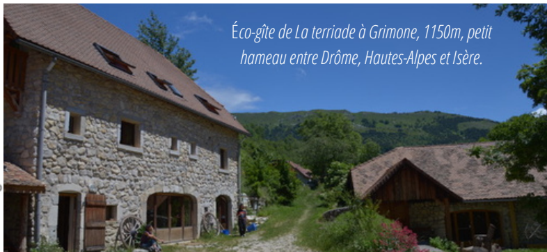
Éco-gîte de La terriade à Grimone, 1150m, petit hameau entre Drôme, Hautes-Alpes et Isère.